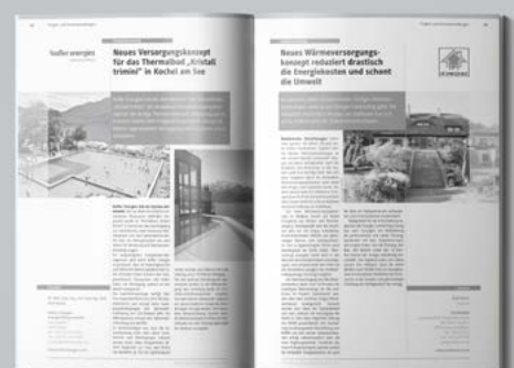
Abb: Seiten aus dem VfW-Jahrbuch 2019/2020